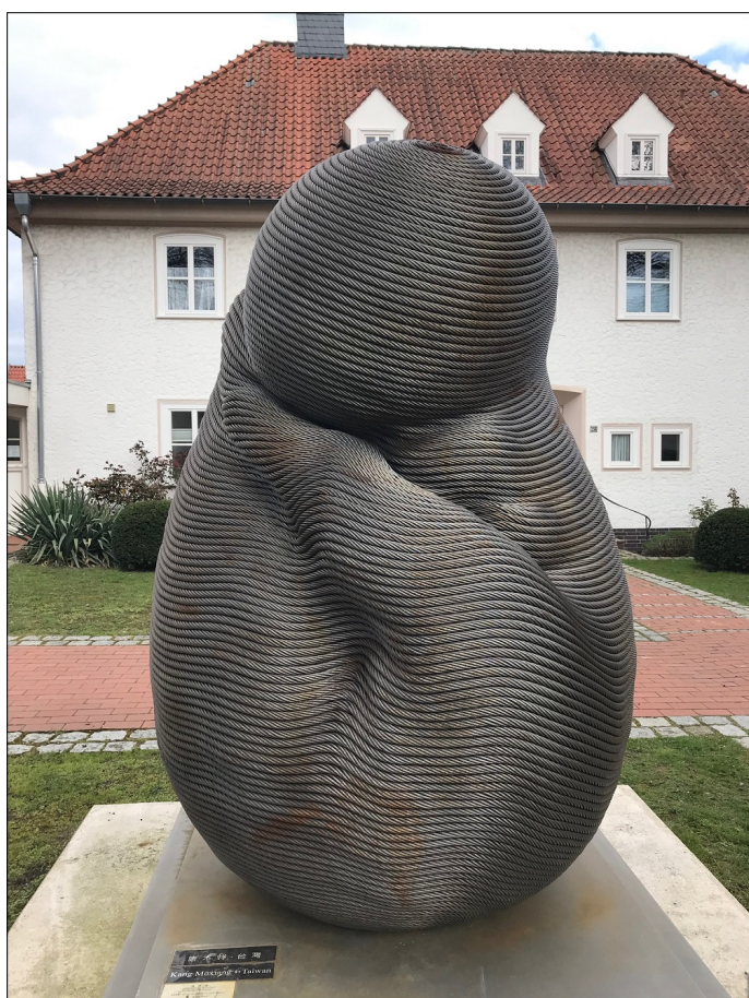
Die ewige Weisheit_Agenda 21