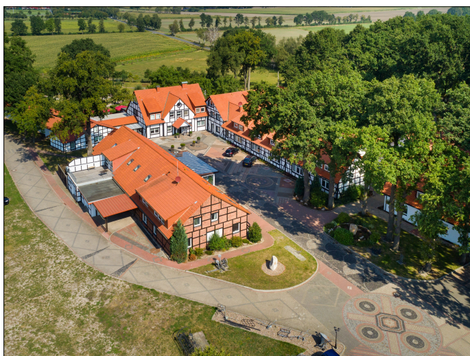
Wohnmobilstellplatz beim Landhotel Baumann's Hof