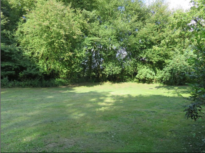
Spielplatz Dürerstraße gr. (Angebotsfläche)

Telefon: 04203 71-0 E-Mail: rathaus@weyhe.de Internet: http://www.weyhe.de