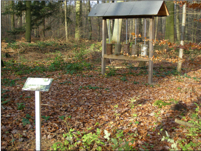
Waldlehrpfad Rathlosen Holzgewichte