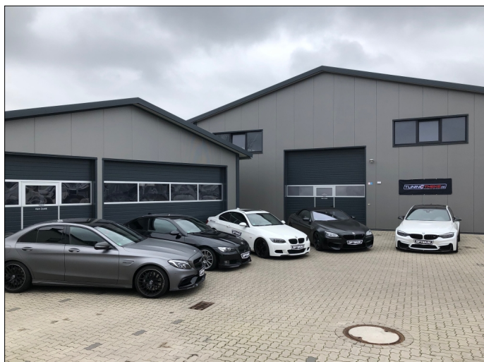
Optimum Maps Fahrzeugtechnik GmbH

Wir, die Optimum Maps Fahrzeugtechnik GmbH, sind ein Meisterbetrieb mit besonderem Fokus, neben normalen Reparaturen und Inspektionen, auf KFZ-Modifikationen, Leistungssteigerungen und Spezialreparaturen/-Wartung.