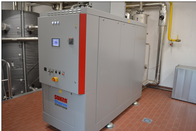
Station 8_Nahwärmenetz Lange Wand