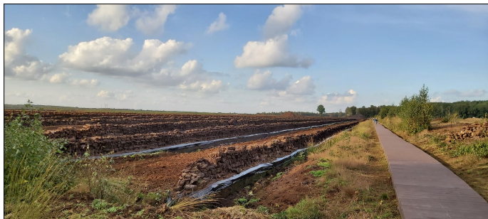
Besuchersteg Aschener Moor

Telefon: 05441 9762222 E-Mail: mail@naturpark-duemmer.de Internet: https://www.naturpark-duemmer.de/